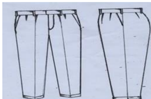
SURUALI – isiwe fupi au ya kubana.