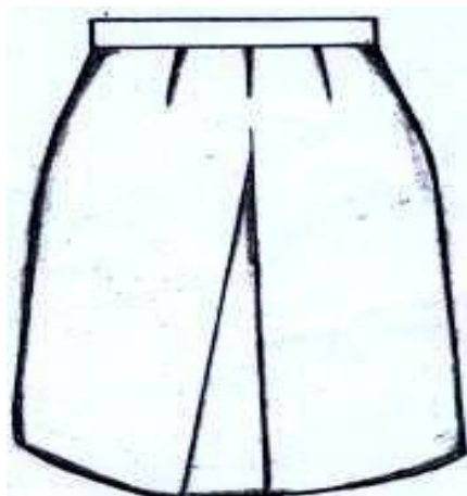
SKETI ndefu ya Heshima Upana wa Chini (hem) inchi 16.